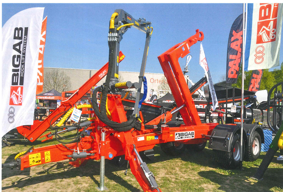
Der Z-Kran ist mit Reichweiten von 6,6 m oder 8 m erhältlich.

Der Kran kann mit einem Greifer oder einer Greifschaufel ausgestattet und funkgesteuert bedient werden. Die Hakenliftsysteme sind bei Bigab von 7 bis 27 t erhältlich. Mehrpreis für Z-Kran mit 6,6 m bzw. 8,8 m Reichweite: 7741 € bzw. 9250 € o. MwSt.