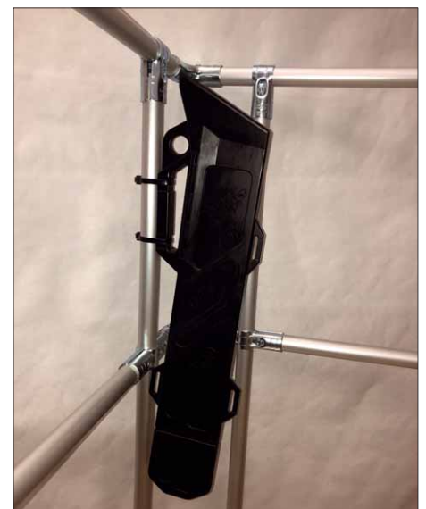
Der Handsägenhalter kann sehr einfach mit ein paar Kabelbindern zum Beispiel an einem Geländer befestigt werden