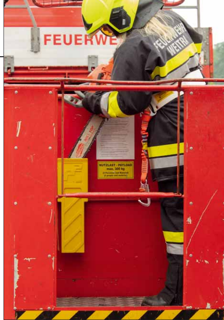
Auch im Arbeitskorb eines Feuerwehrwagens findet der Motorsägenhalter einen Platz

mit Gurten im Halter gegen Herausfallen oder -rutschen gesichert werden.