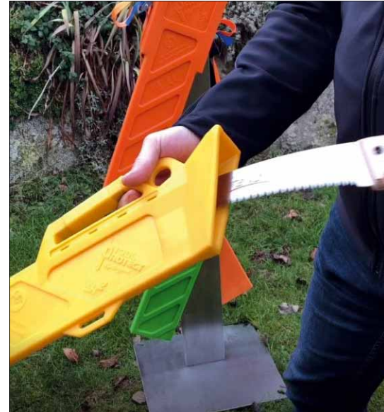
Der SH2-Pro kann mit unterschiedlichen Sägen bestückt werden und ist so universell einsetzbar

Grundsätzlich sollte deshalb beim Arbeiten mit der Motorsäge geeignete Schutzausrüstung getragen werden: Gehörschutz, Gesichtsschutz oder ein mit beidem ausgestatteter Waldhelm, Handschuhe sowie Hose und Schuhe mit Schnittschutzausrüstung sind Pflicht