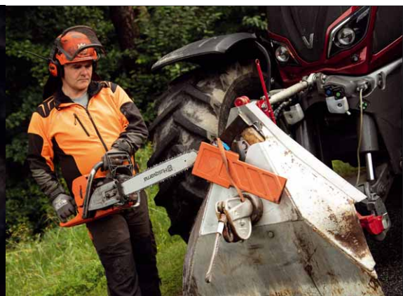
Die Motorsäge kann sicher mit beiden Händen entnommen werden

Durch den Sicherungsgurt bleibt die Maschine immer sicher im Halter