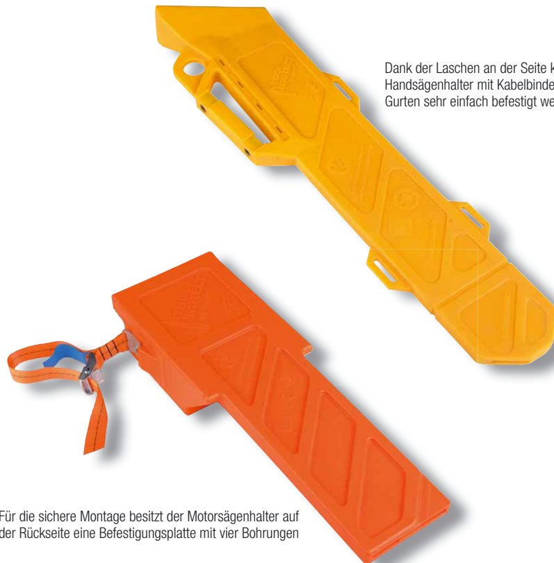
Dank der Laschen an der Seite kann der Handsägenhalter mit Kabelbindern oder Gurten sehr einfach befestigt werden