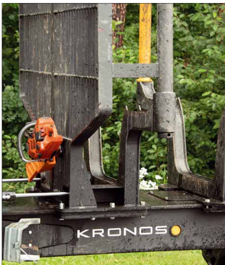
Auch auf Holztransportern werden Kettensägen regelmäßig benötigt. Mit dem Motorsägenhalter kann auch hier eine Säge sicher platziert werden

In unserem Test haben wir die Halter an verschiedenen Plätzen montiert. Dabei haben wir sowohl die feste Montage als auch die vorübergehende (nur bei dem Handsägenhalter) ausprobiert. Dabei zeigte sich, dass die Montage einfach, sicher und schnell von der Hand geht. Einmal platziert, können sowohl Handsägen als auch Motorsägen sicher gelagert werden. Dabei sind sie sowohl schnell zu entnehmen als auch sehr einfach nach der Arbeit zu sichern. In unserem Test haben wir verschiedene Motor- und Handsägen in den Haltern ausprobiert und geschaut, wann und unter welchen Umständen sie herausfallen können.