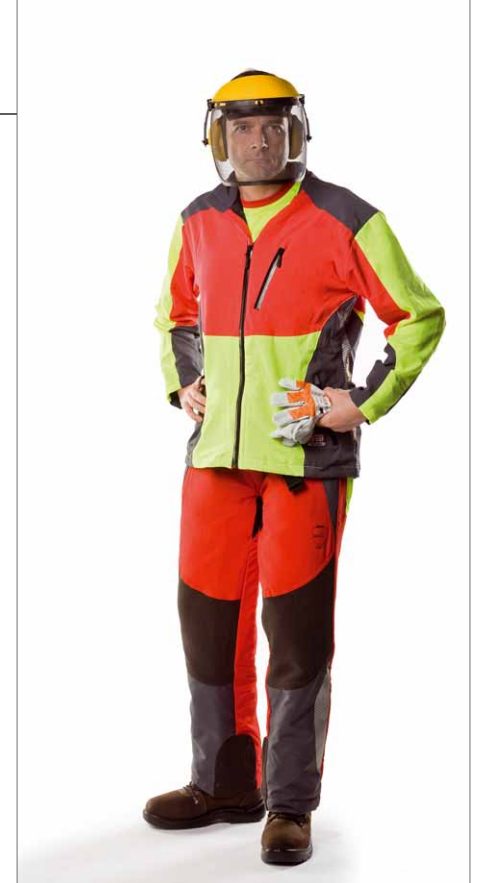
Ohne die passende Schutzausrüstung sollte man die Kettensäge nicht anfassen

Oberklasse 1,3 Preis/Leistung: gut – sehr gut MOTOR & MASCHINE