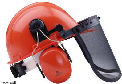
Wer Bäume fällen will, sollte einen kompletten Waldhelm tragen