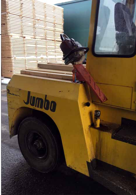
Sogar auf dem Gabelstapler einer Holzhandlung schafft der Motorsägenhalter den Platz für eine Säge