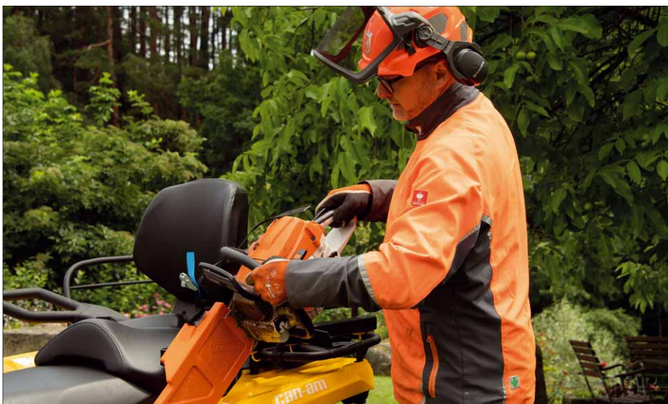
Der Motorsägenhalter kann an beinahe jedem Fahrzeug montiert werden

Die Hand- und Motorsägenhalter sind dafür gedacht, Hand- und Motorsägen während des Einsatzes sicher zu verwahren, denn es kommt im Galabau und bei der Waldarbeit immer wieder zu Unfällen durch unsachgemäßes Ablegen von Sägen. Die Halter von Toolprotect sollen dies nach Möglichkeit verhindern, indem den Sägen feste Plätze zugewiesen werden. Befinden sich die Sägen im Halter, sind sie für den Benutzer ungefährlich. Motorsägen können für den Transport